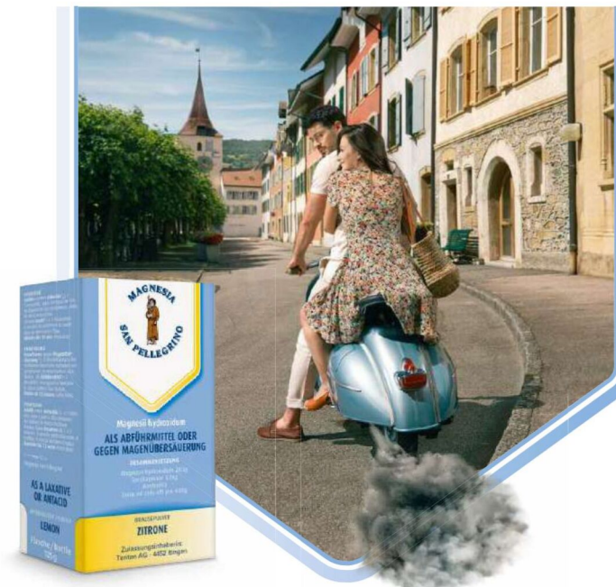
Dies ist ein zugelassenes Arzneimittel. Bitte lesen Sie die Packungsbeilage.